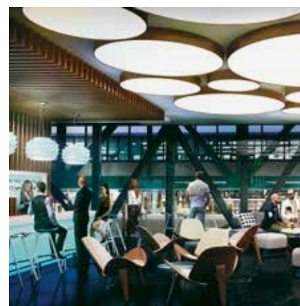
Das neue AMERON München Motorworld freut sich mit abwechslungsreicher Gastronomie auf Sie!

Insgesamt 156 Themenzimmer bestechen durch ihr einzigartiges Ambiente und sind speziell für Motorsportfreunde ausgestattet. Auch für Veranstaltungen – Tagungen, Incentives, Teambuilding-Events und mehr – stehen verschiedene Räumlichkeiten für bis zu 2.000 Personen zur Verfügung. Entspannen können Sie im 150 m 2 großen Vitality Spa, das ein umfassendes Spa-, Beauty- und Fitnessangebot für Sie bereithält. Dazu gehören unter anderem zwei Saunen mit Blick auf die beleuchteten Glaskuben der Autohalle.