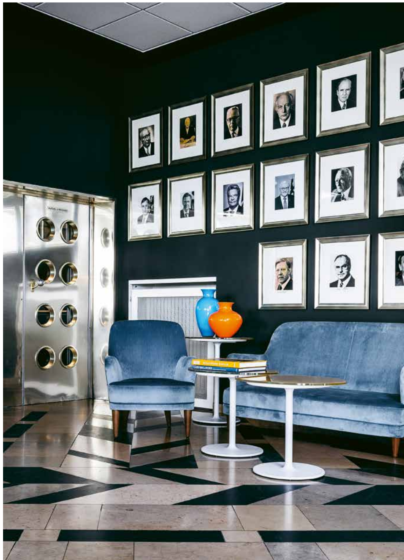
AMERON Bonn Hotel Königshof

AMERON STEHT FÜR HOTELS MIT PERSÖNLICHKEIT.