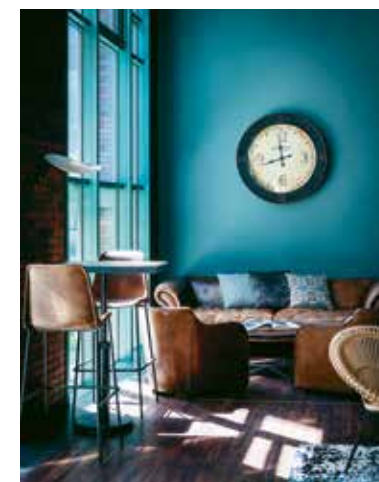
AMERON Berlin Abion Spreebogen Waterside