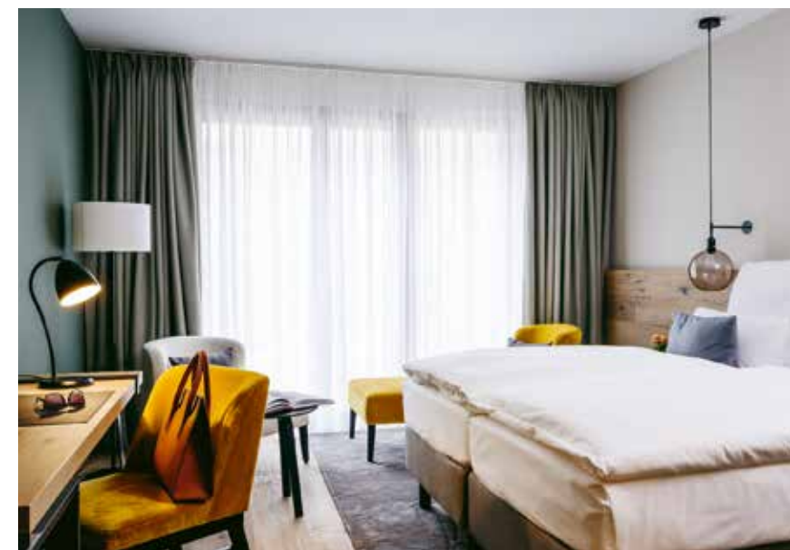
Der architektonische Charme der Bestandshäuser ist erhalten geblieben, während das Interieur behutsam umgestaltet wurde.

Auch die außergewöhnliche Landschaft und Lage tragen zur besonderen Anziehungskraft von Schwangau bei. Eingebettet zwischen den kristallklaren Gewässern von Schwannsee und Alpsee sowie der majestätischen Gebirgskulisse